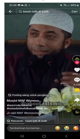
Gambar 18: Menurut Ulama sebagai Transgender