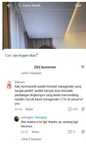
Gambar 3: Kolom komentar akun TikTok Ian Hugen