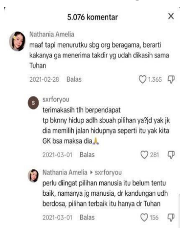
Gambar 5: Kolom komentar akun TikTok Ian Hugen