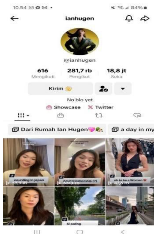
Gambar 1 : Akun TikTok Ian Hugen