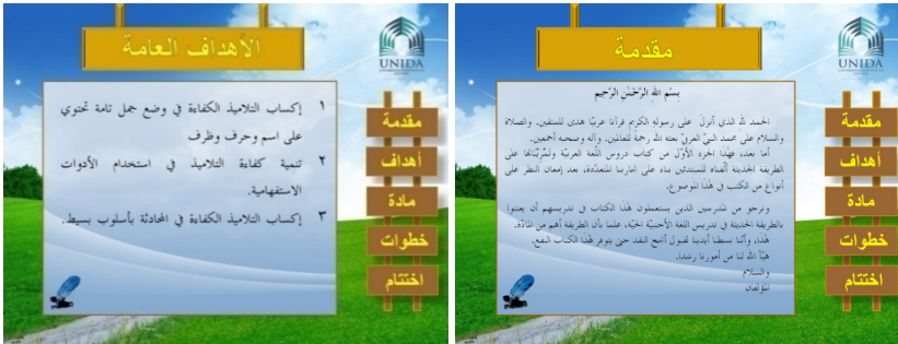
رقم الشاشة (٢)

٣. شاشة العرض المقدمة تتكون من أربعة الشاشات. الشاشة الأولى المقدمة، تعرض عن كيفية استخدام برنامج التعليم من خلال البيان القصير. والشاشة الثانية الأهداف، تعرض عن الأهداف العامة للتدريس. والشاشة الثالثة مادة التدريس، تعرض عن فهرس المواد من الدرس الأول إلى الدرس الخامس والعشرون بطريقة ضغطة الموس (esuom) الأيسر على الصندوق الصغير وفيه رقم الدرس مع الصوت فيه. والشاشة الرابعة خطوة التدريس، تعرض عن الطريقة العامة التي مستخدمة لتعليم هذا الكتاب. وبجانب ذلك استعمل الباحث بعض الألوان وهي اللون الأخضر كخلفية الشاشة الذي يحمله معنى الجمال والثقة والتفاؤل، والنشاط، وذلك أن هذا الجهاز يكون مسوقا وجميلا بالإضافة إلى دفع الملل ويزيد الرغبة. وعلى ضوء ذلك فياتي الباحث بصورة التالية: