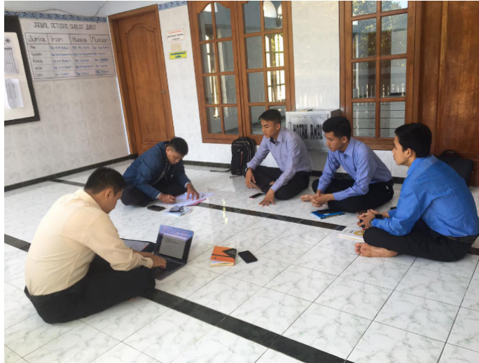
Gambar 4.1. Diskusi dan Evaluasi Kegiatan Mingguan Tim Pelaksana