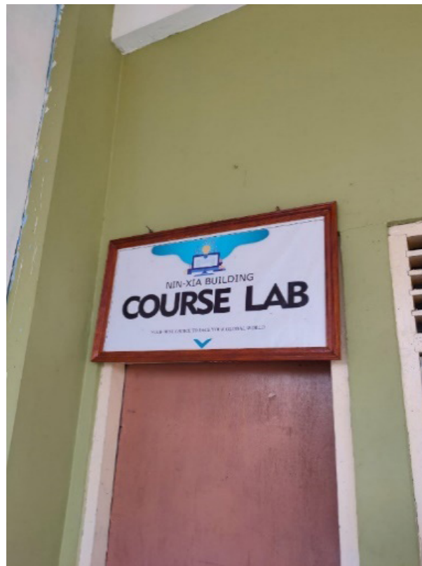
Gambar 1.2. (Laboratorium Kursus Bagi Santri Gontor)

Selain itu DCC juga ditujukan untuk kemandirian pondok dalam bidang Informasi dan Teknologi (IT) tanpa mengesampingkan tujuan utama yaitu untuk pendidikan santri di bidang IT. Pada saat ini DCC telah dapat memenuhi kebutuhan-kebutuhan santri, guru dan unit-unit usaha di pondok dalam bidang komputerisasi. Pada saat ini, seiring berjalannya waktu, kegiatan kursus di DCC berjalan dengan baik dan semakin berkembang. Namun, dalam suatu kursus sangatlah penting bagi penyelenggara untuk memiliki sistem modul dan bahan ajar yang baik demi terlaksananya kursus yang efektif, baik dari penyelenggaranya (Pritandhari & Wibawa, 2021), pesertanya, bahan ajarnya, dan segala aspek yang menunjang kursus tersebut di DCC.