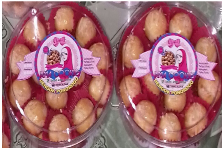
Gambar 1. Produk Mitra IKM Mirasa kue dan IKM Irma Cookies belum ber-PIRT

Permasalahan mitra IKM Ponorogo adalah belum adanya legalitas layak edar bagi produk-produk IKM berupa jaminan keamanan pangan dari pemerintah berupa izin PIRT, sehingga secara peraturan pemerintah belum sah dan belum layak untuk di edarkan kepada masyarakat luas. Melihat permasalahan tersebut, kami membantu untuk mendapatkan sertifikat PIRT dengan beberapa tahap.