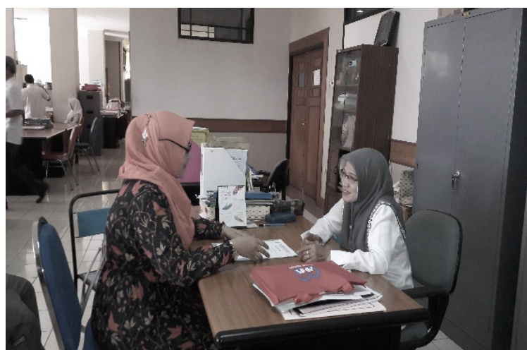
Gambar 2. Pengajuan dokumen persyaratan PIRT ke Dinas Kesehatan

Tahapan pertama pada kegiatan masyarakat ini adalah mensosialisasikan pentingnya jaminan layak edar bagi produk hasil produksi IKM. Legalitas layak edar berupa izin PIRT (pangan industri rumah tangga) merupakan izin yang harus dimiliki oleh usaha produk makanan IKM mitra, hal ini berarti dari proses bahan baku hingga pengolahan dan produksi telah sesuai dengan syarat dan ketentuan keamanan pangan sehingga aman untuk dikonsumsi masyarakat. Tahap berikutnya adalah tahap pelaksanaan yaitu dengan membawa dokumen persyaratan untuk pengajuan PIRT ke Dinas Kesehatan Kabupaten Ponorogo.