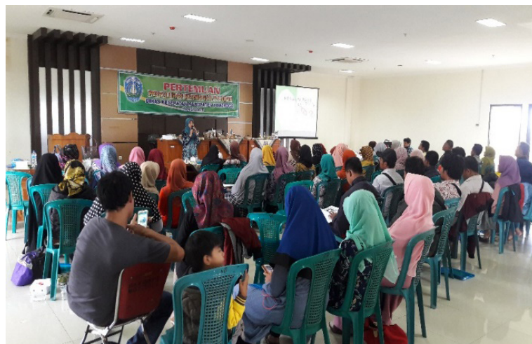
Gambar 3. Agenda pendampingan penyuluhan PIRT di Dinas Kesehatan kabuapten Ponorogo