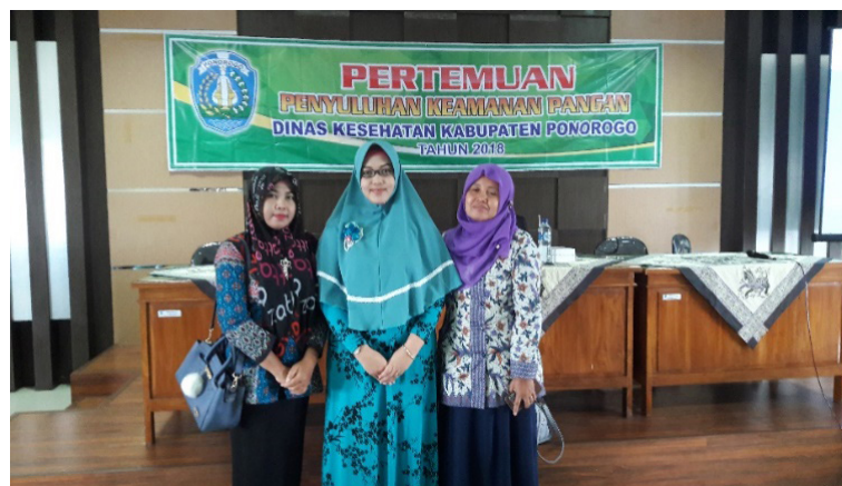
Gambar 4. Foto bersama mitra ketika pendampingan penyuluhan