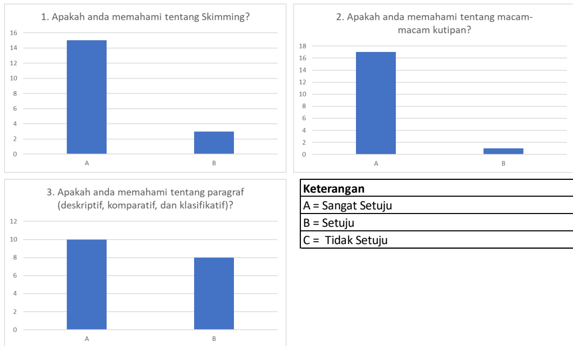
Gambar 3. Data Post-test

Setelah seluruh rangkaian pelatihan selesai, dilakukan post-test untuk menilai perkembangan pemahaman peserta terhadap materi yang diberikan.