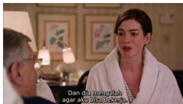
Gambar 4. Scene Jules dan Ben Mengobrol di kamar Hotel