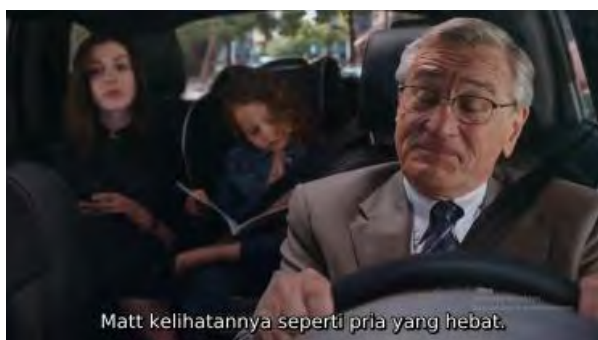
Gambar 2. Scene Jules dan Ben Mengobrol di Mobil