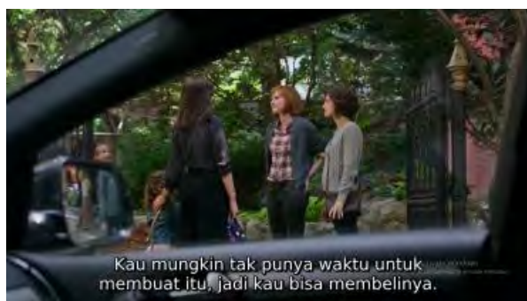
Gambar 1. Scene Jules Bertemu dengan Orang Tua Murid di sekolah Paige