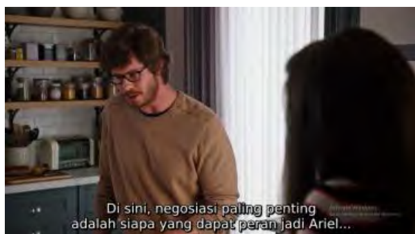
Gambar 6. Scene Ketika Matt Antusias Untuk Menjadi Princess Ariel