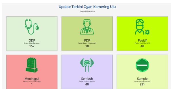
Gambar 3. Data Kasus Covid-19 di Kabupaten Ogan Komering Ulu

Sumatera Selatan merupakan salah satu provinsi di Indonesia yang terdampak Covid-19. Salah satu Kabupaten di Sumatera Selatan yang menjadi penyumbang kasus positif-19 yang cukup tinggi adalah Kabupaten Ogan Komering Ulu. Jumlah pasien yang berstatus Positif Covid-19 di Kabupaten Ogan Komering Ulu mencapai 40 orang pada tanggal 20 Agustus 2020, angka ini merupakan jumlah yang cukup tinggi di dibandingkan dengan Kabupaten/Kota yang berada di wilayah Provinsi Sumatera Selatan, hal ini seperti terlihat pada gambar data berikut :