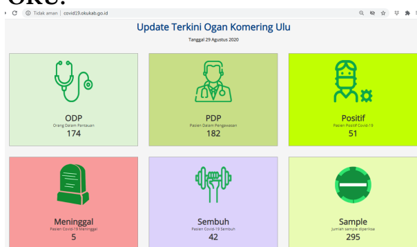
Gambar 5. Data Covid-19 Kabupaten OKU.