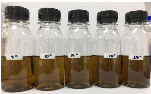
Gambar 2. Hasil Ekstrak daun sirih

optimum ekstraksi ultrasonik. Hal ini ditunjukkan juga oleh Melecchi dkk (2006), pada ekstraksi dengan gelombang ultrasonik semakin lama waktu ekstraksi maka rendemen yang dihasilkan akan meningkat sampai kondisi optimal, hingga pada titik tertentu rendemen akan mengalami penurunan. Terjadinya penurunan ini dikarenakan adanya senyawa organik yang terdekomposisi karena efek dari gelombang ultrasonik. Hasil ekstrak dapat dilihat pada gambar 2.