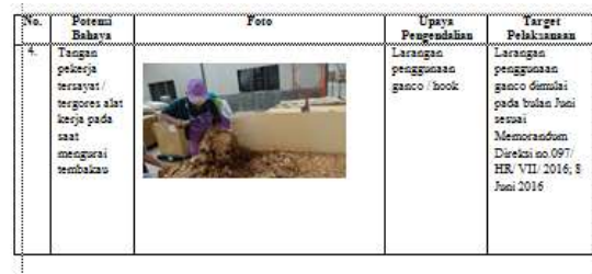
Tabel 2 Tabel Identifikasi Bahaya

Sistem Manajemen Keselamatan dan Kesehatan Kerja, perencanaan sistem keselamatan dan kesehatan kerja paling sedikit memuat: tujuan dan sasaran, skala prioritas, upaya pengendalian bahaya, penetapan sumber daya, jangka waktu pelaksanaan, indikator pencapaian, dan sistem pertanggungjawaban. PT Nojorono Tobacco International sejauh ini telah melakukan identifikasi bahaya, penilaian dan pengendalian risiko, tetapi belum dilakukan di seluruh area kerja. Berikut adalah tabel identifikasi potensi bahaya di area preblending primary process . (terlampir, tabel 2)