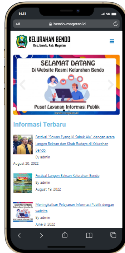
Gambar 2. Homepage dari website Kelurahan Bendo versi Smartphone .

Metode usability dibagi menjadi dua kategori yaitu metode empiris dan metode inspeksi. Metode empiris ini terbagi dalam dua bagian yaitu metode penyelidikan (seperti wawancara, kuesioner, dan survei), dan pengujian kegunaan formal (seperti interaksi dengan situs web untuk melakukan tugas tertentu). Penelitian ini bertujuan untuk mengukur tingkat usability dari desain user interface website kelurahan Bendo dengan menggunakan System Usability Scale (SUS). Peneliti menggunakan SUS untuk menjawab klaim penelitian tentang kegunaan (berpotensi atau tidak). SUS dipilih karena responden dapat melengkapi pernyataan dengan cepat dan mudah, hanya terdapat 10 pernyataan dalam survei dan hasil survei berupa skor tunggal (0-100), sehingga relatif lebih mudah dipahami.